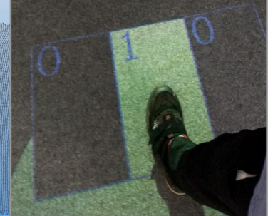
ZBS-Versuchsplattform mit Sensor- Projektor-Verbund